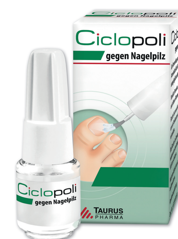
Ciclopoli gegen Nagelpilz* 3,3 ml