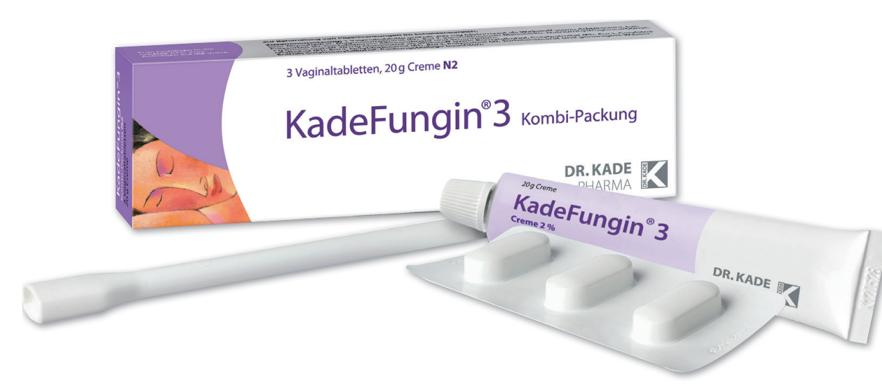
KadeFungin 3 Kombipackung* 20 g Creme + 3 Vaginaltabletten