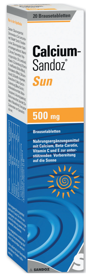
Calcium Sandoz Sun 20 Brausetabletten

3,25 € gespart AAP 1 8,20 € 4,95 € 100 g = 33,00 €