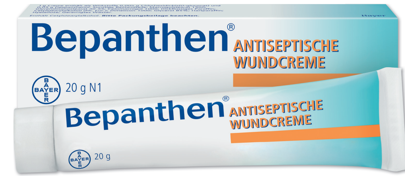
Bepanthen antisept. Wundcreme* 20 g

2,47 € gespart AAP 1 5,97 € 3,50 € 100 g = 17,50 €