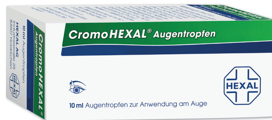
CromoHEXAL Augentropfen* 10 ml