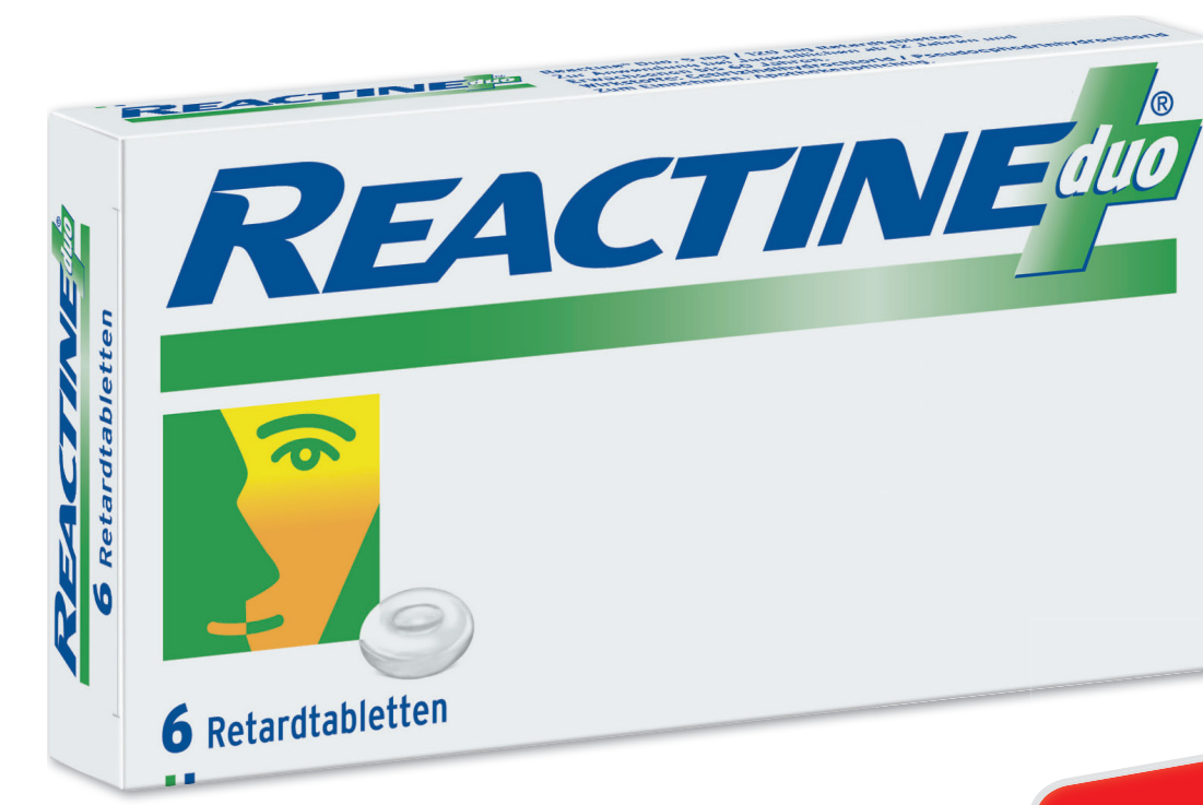
Reactine duo Retardtabletten* 6 Tabletten