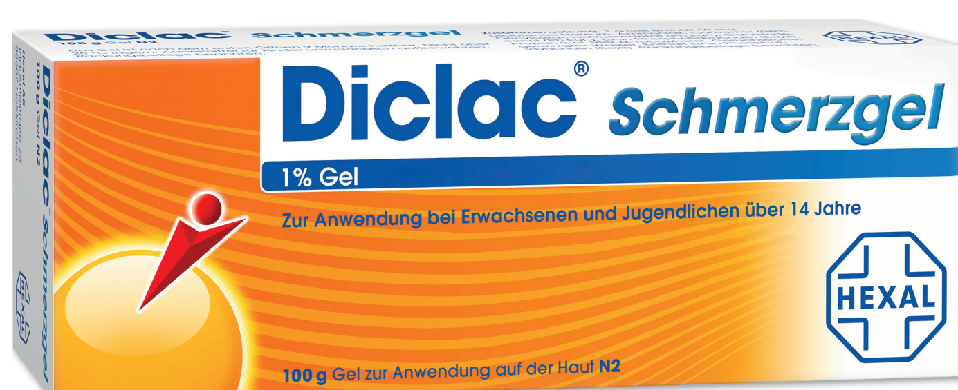
Diclac Schmerzgel* 100 g