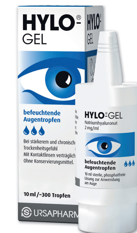
HYLO-GEL Augentropfen 10 ml