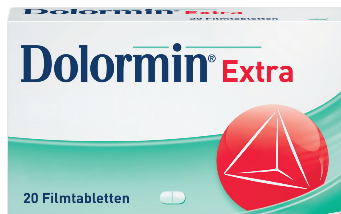
Dolormin Extra* 20 Tabletten