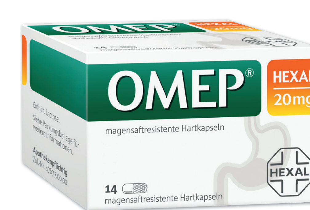
Ome Hexal 20 mg* 14 Hartkapseln