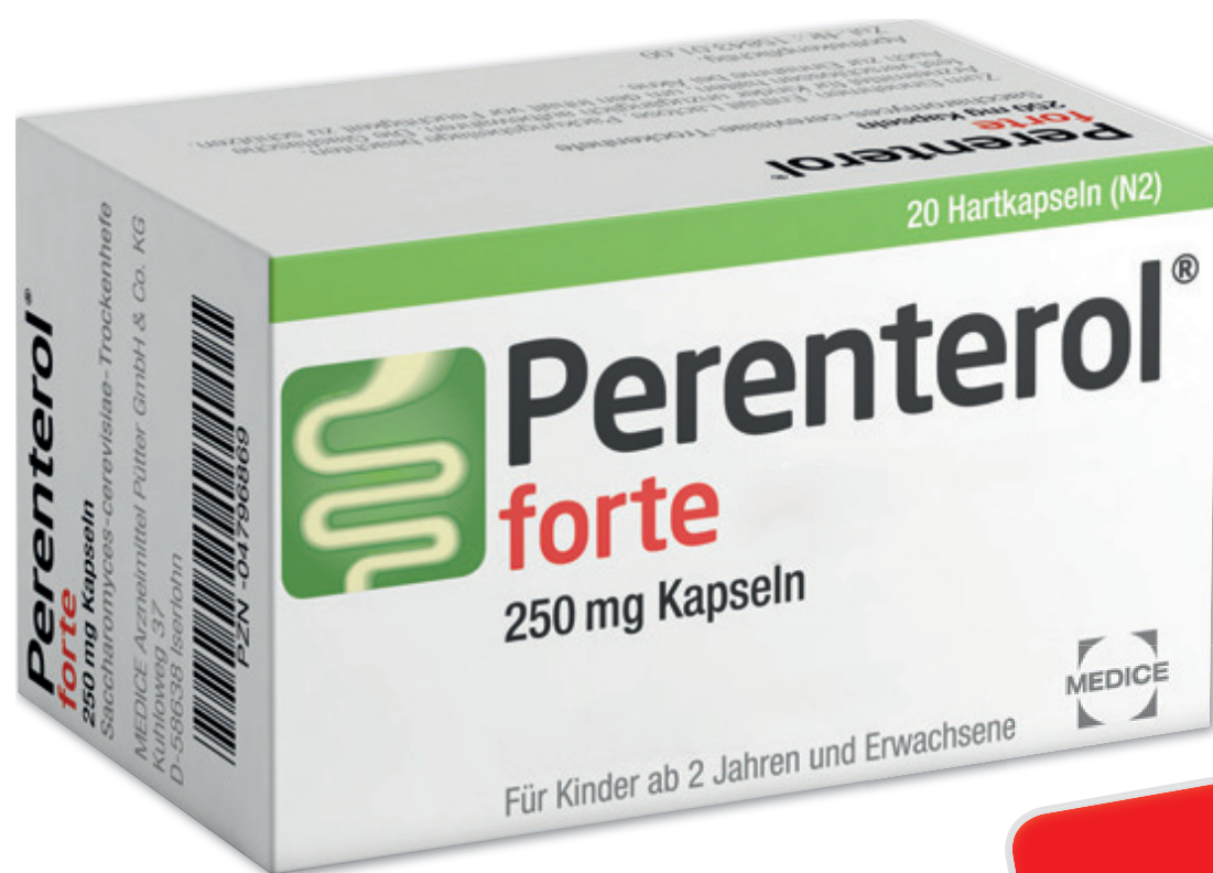
Perenterol forte 250 mg* 20 Hartkapseln