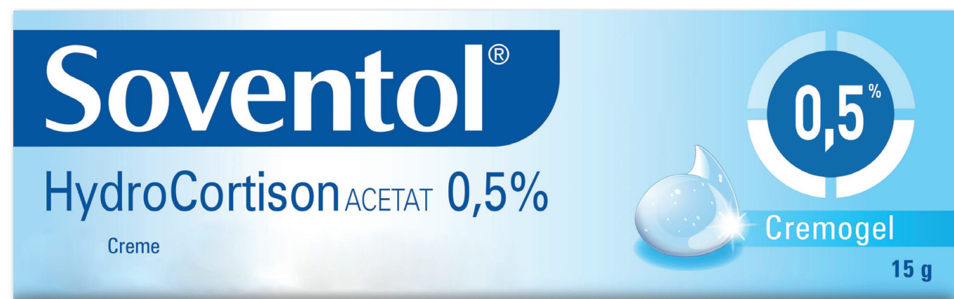
Soventol HydroCortison Acetat 0,5% Creme* 15 g

3,25 € gespart AAP 1 8,20 € 4,95 € 100 g = 33,00 €