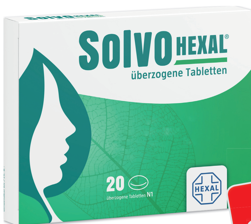
SolvoHexal* 20 Tabletten

2,47 € gespart AAP 1 5,97 € 3,50 € 100 g = 17,50 €